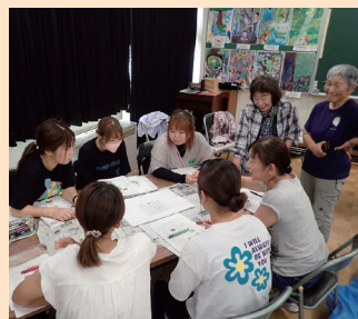
みどりの教室 (袖ヶ浦市)