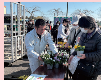
さんむ苺まつり (山武市)