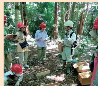
おとなの木育 (千葉市)