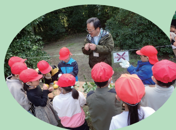
小学校の校外学習支援 (袖ヶ浦市)