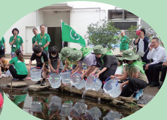
緑の少年団による学校や 地域の緑化活動 (流山市)