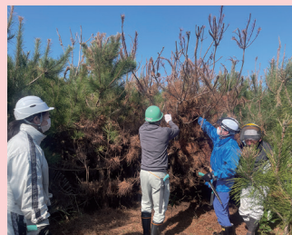
緑の募金の森 (海岸林) の造成 (旭市)