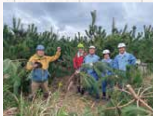
緑の募金の森(海岸林)の造成 (旭市)