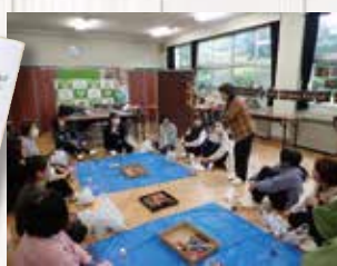
みどりの教室(袖ヶ浦市)