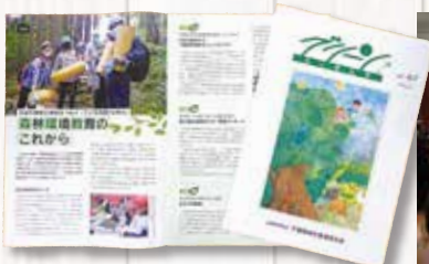
広報誌グリーンえっせんすの発行等