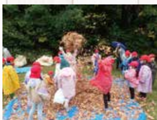
小学校の校外学習支援(袖ヶ浦市)