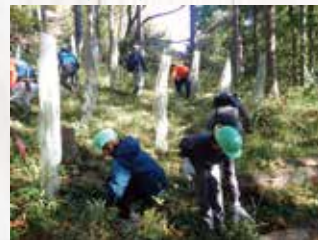
第44回緑の少年団交流集会 (大多喜町)