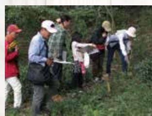
ときがね湖自然観察会(東金市)