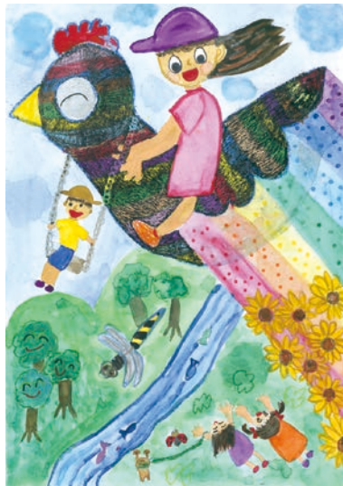
2 学年 久保木 千晶