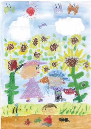
1 学年 高塚 沙優