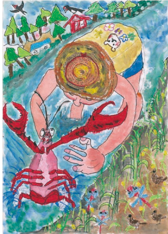
4 学年 福島 奏菜