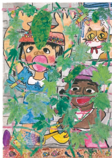
3 学年 平野 すみれ