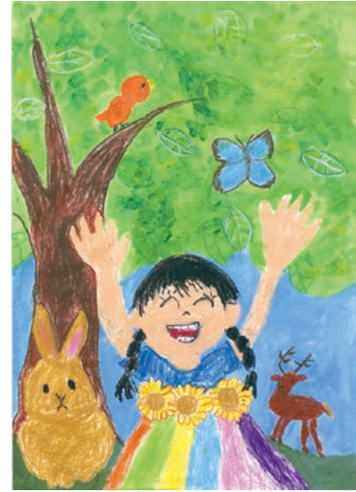
1 学年 橋本 滯