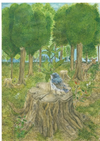
3 学年 石井 愛華