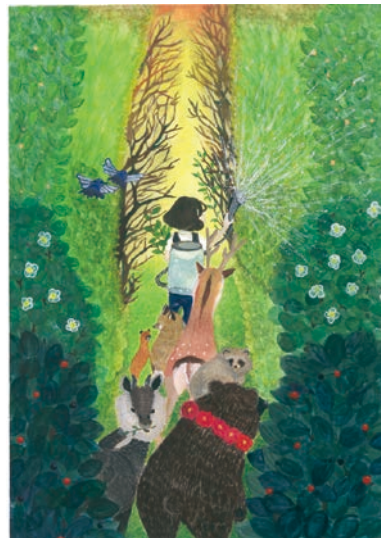
5 学年 橋本 楓花