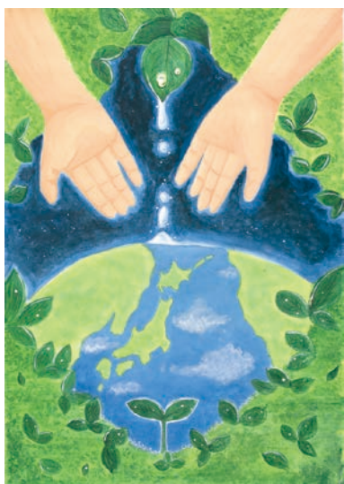
1 学年 嶋田 輝星