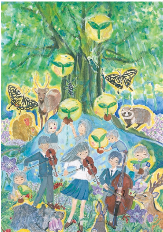
1 学年 松村 紅里