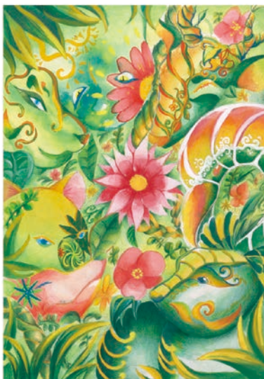
3 学年 寺内 真緒