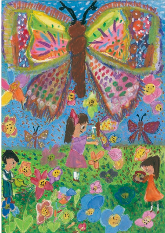
2 学年 古田 桃彩