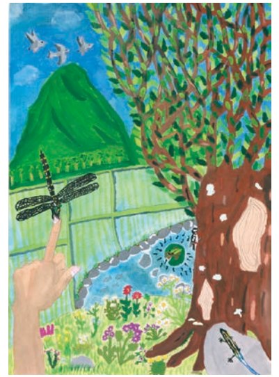
3 学年 樋口 実里