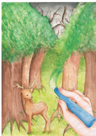
1 学年 小泉 結花