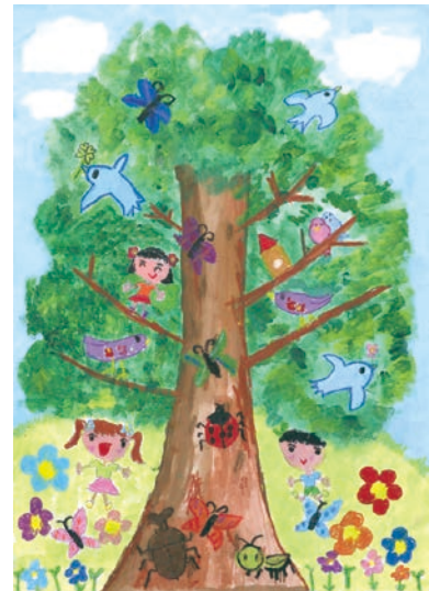
2 学年 松井 和花