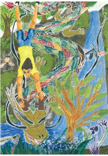
5 学年 戸田 笙一郎