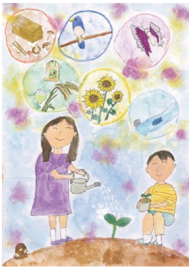
3 学年 岡田 恵奈