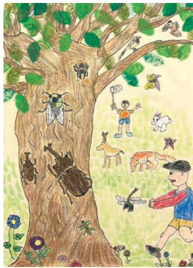
1 学年 飯箸 遼之介