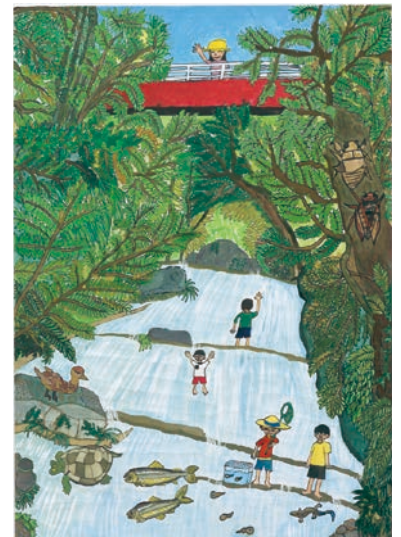
5 学年 板倉 太郎