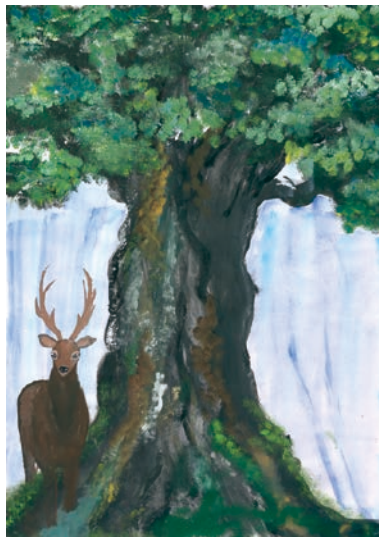
5 学年 川越 ゆきの