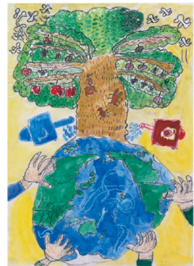
3 学年 岡崎 健人