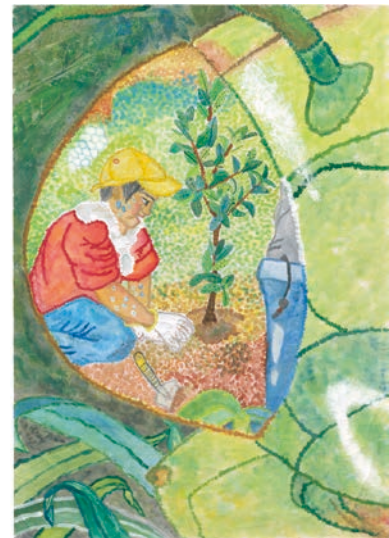
5 学年 平野 慈人