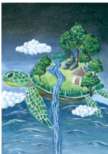
2 学年 竹内 ひまり