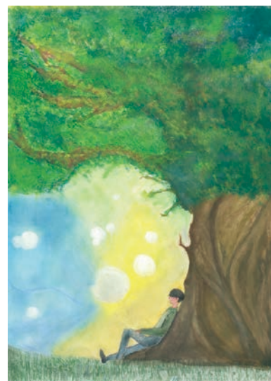
2 学年 若林 蓮香