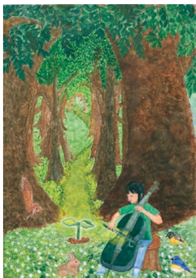
2 学年 鵜澤 里彩