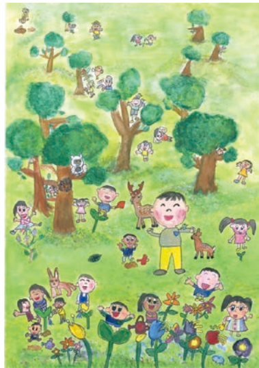
2 学年 安藤 夏蓮