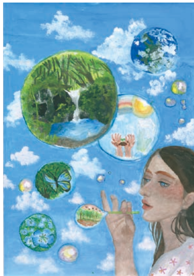
6 学年 田中 里奈