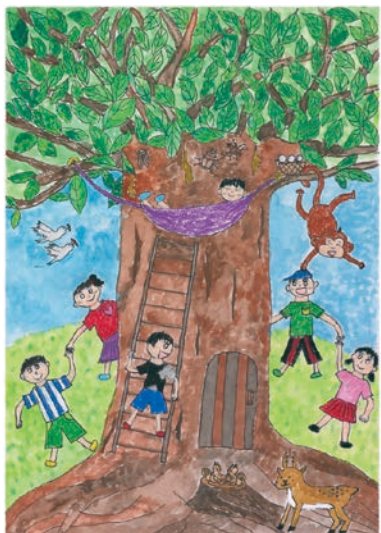
3 学年 穴山 泰誠