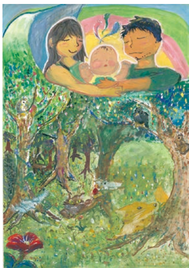
1 学年 外山 木乃