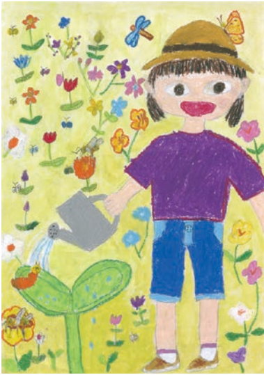
1 学年 伊藤 颯花