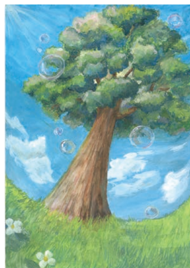
2 学年 水野 福乃