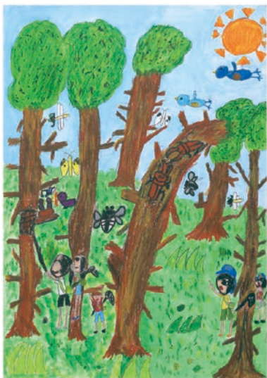
2 学年 日高 花