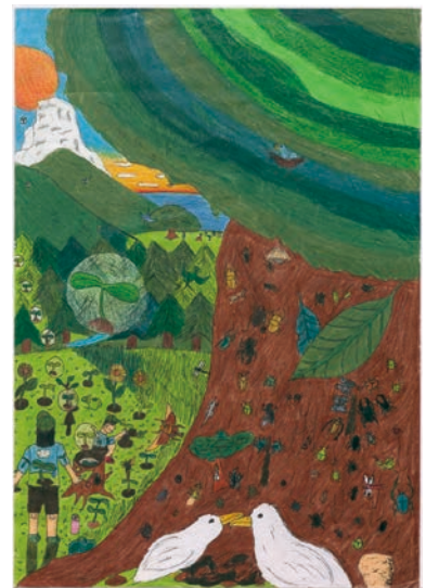
6 学年 坂本 鼓伯