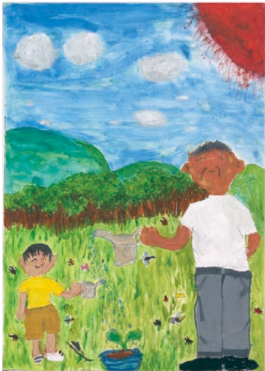
2 学年 小美濃 新汰