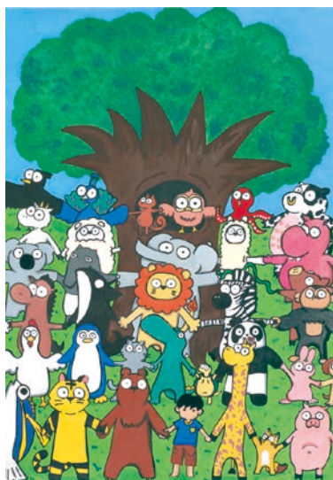
2 学年 西野 凜