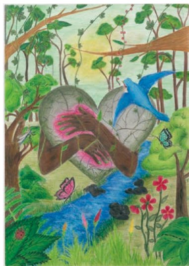
6 学年 モハドガニファティアイ