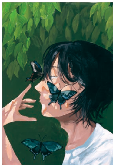
2 学年 岩月 莉奈