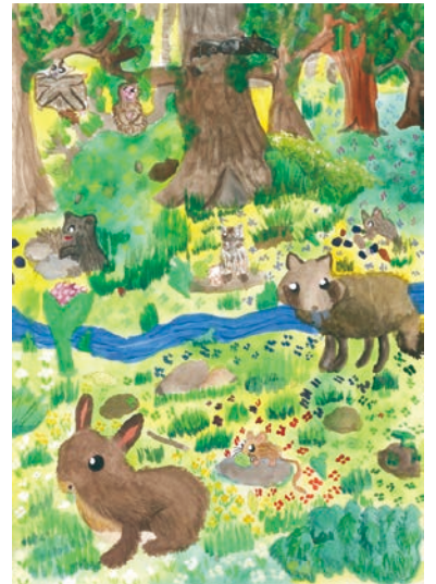
4 学年 菊地 弥音