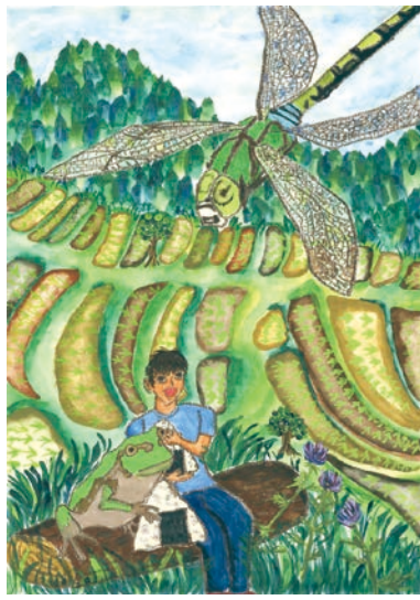
5 学年 戸田 悠一郎