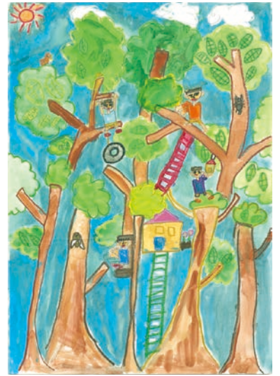
2 学年 古瀬 武蔵