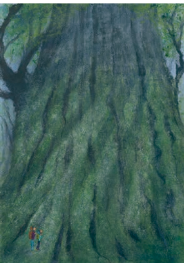
6 学年 永井 秀弥