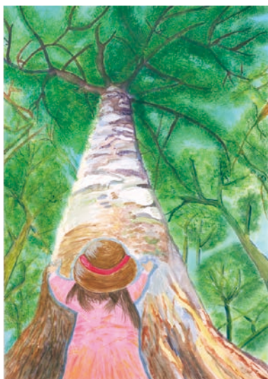
1 学年 松尾 春奈