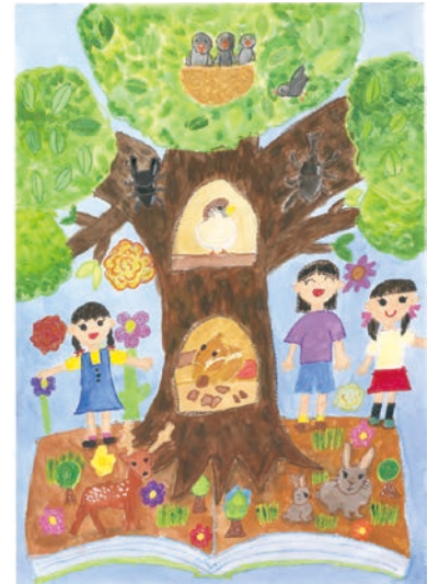
3 学年 齋木 このみ