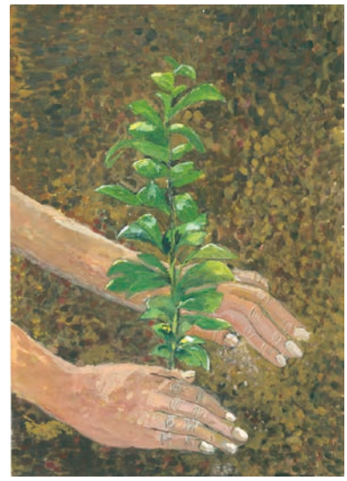
6 学年 松田 真由香