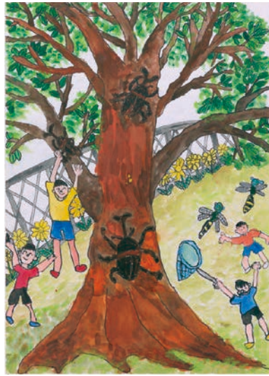
1 学年 田邊 奏斗