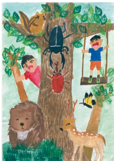
4 学年 高橋 陽向