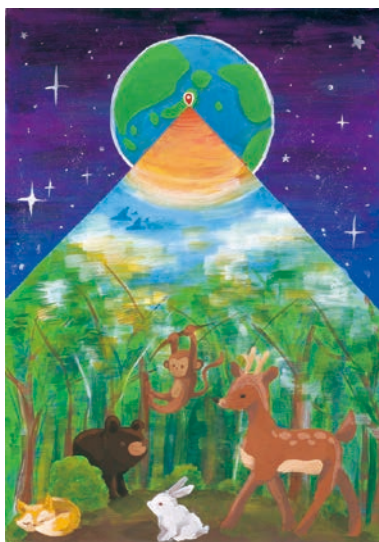
1 学年 立脇 樹