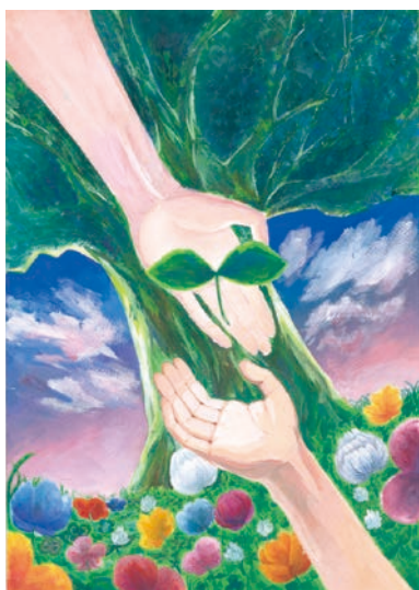
3 学年 吉村 千尋