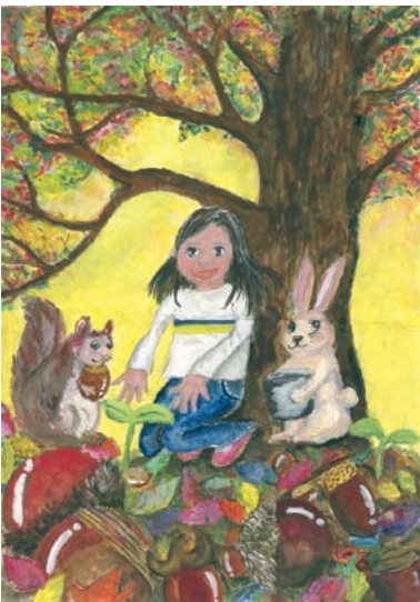
6 学年 小林 真奈