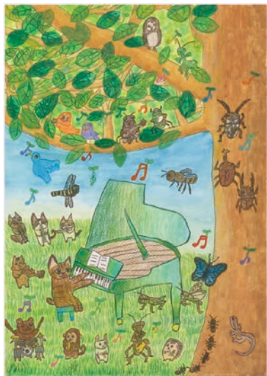
4 学年 松野 文香