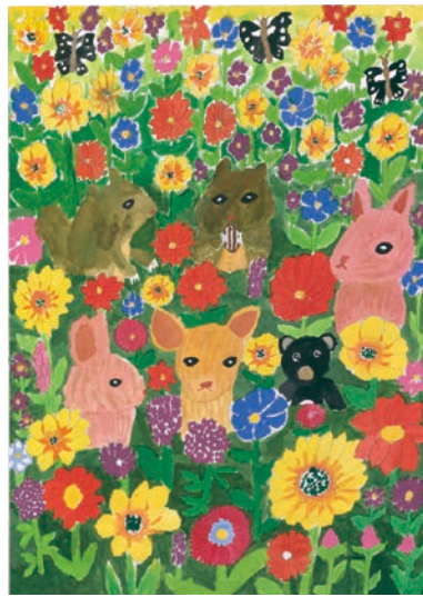
4 学年 出川 未華