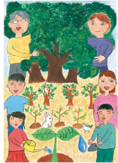
4 学年 菅野 真子