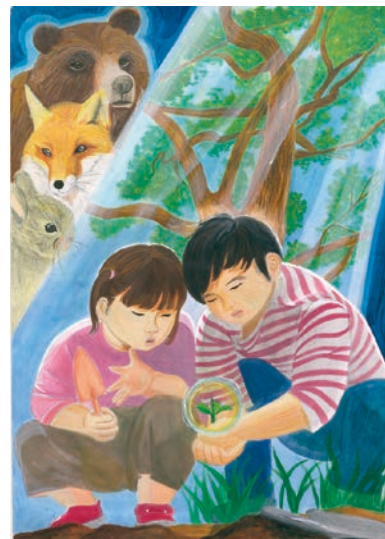
3 学年 吉沼 美陽