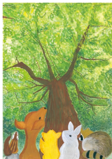
1 学年 小西 愛華