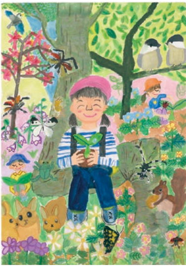
4 学年 松村 有紗