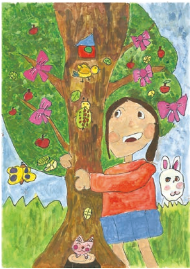
1 学年 岩瀬 心郁