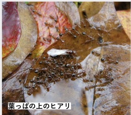
葉っぱ上のヒアリ